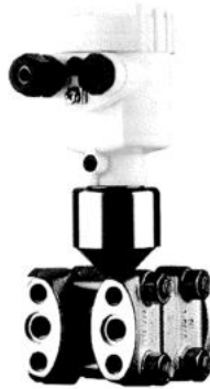
Рис. 11. Общий вид преобразователя давления измерительного VEGADIF 65