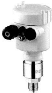
Рис. 5. Общий вид преобразователя давления измерительного VEGABAR 53