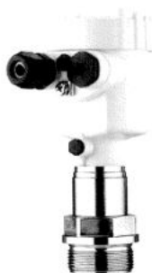
Рис. 7. Общий вид преобразователя давления измерительного VEGABAR 55