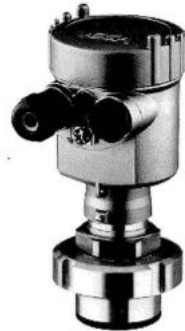
Рис. 4. Общий вид преобразователя давления измерительного VEGABAR 52