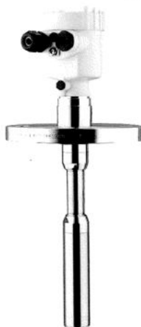
Рис. 8. Общий вид преобразователя давления измерительного VEGABAR 66