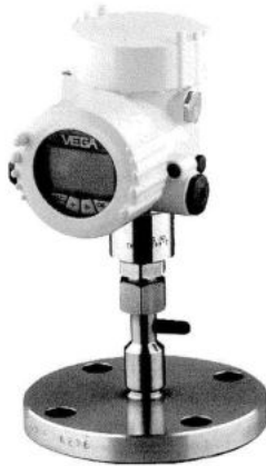
Рис. 3. Общий вид преобразователя давления измерительного VEGABAR 51