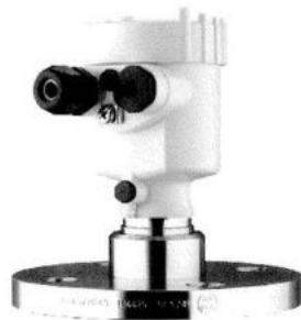
Рис. 6. Общий вид преобразователя давления измерительного VEGABAR 54